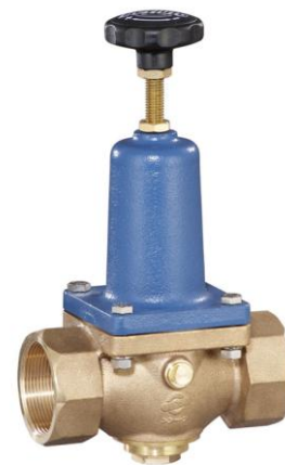
DN 40 - DN 50 (DRV 302-6)