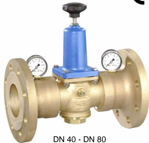
DN 40 - DN 80 (provedení / design DN 80)