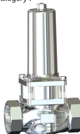
DN 40 - DN 50