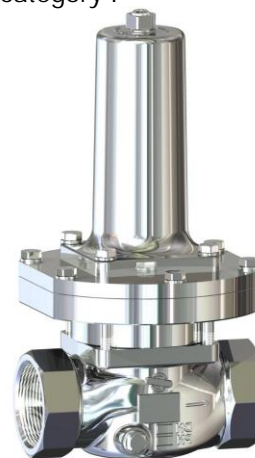
DN 40 - DN 50