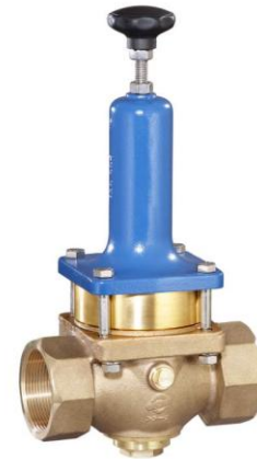
DN 40 - DN 50 PN 25