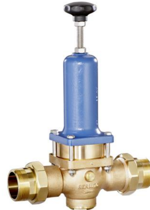
DN 40 - DN 65 PN 25