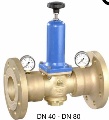
DN 40 - DN 80 (provedení / design DN 80)