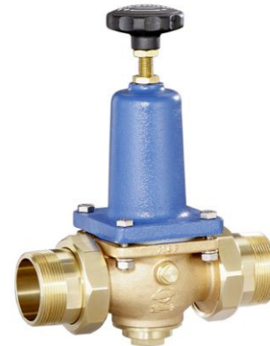
DN 40 - DN 65 (DRV 402-6)