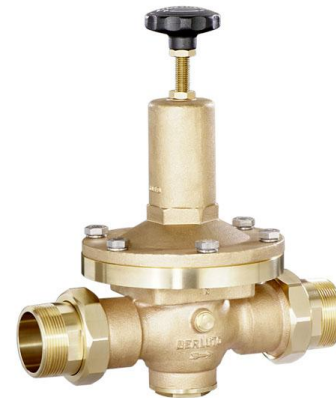
DN 40 - DN 65