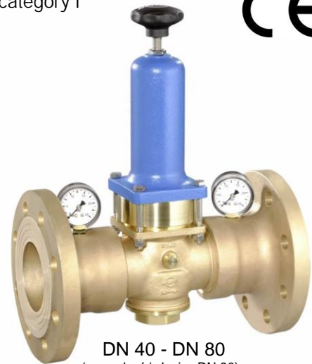
DN 40 - DN 80 (provedení / design DN 80)