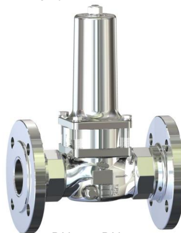
DN 40 - DN 50