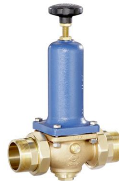
DN 40 - DN 65 PN 25