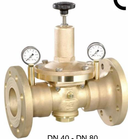
DN 40 - DN 80 (provedení / design DN 80)