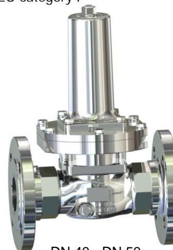
DN 40 - DN 50